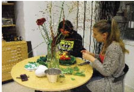
フラワーアレンジ実習