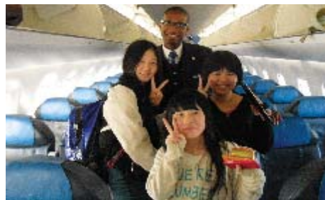
機内で乗務員とのショット