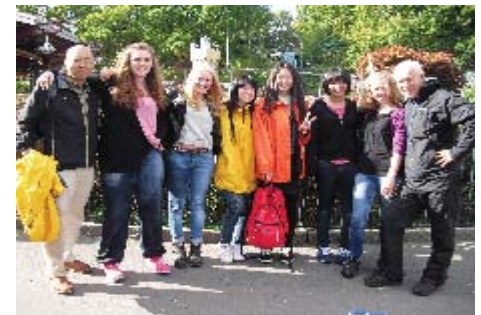
イエーテボリ観光(遊園地)