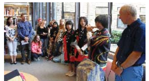
歓迎セレモニーで、和太鼓部の法被を着て篠笛披露