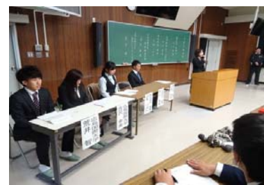
講演会の様子(上下)

本校卒業生を5名を招き、2・3年生を対象に講演会を実施しました。5限目は、これから受験や就職に向けた取り組みを本格化させていく2年生へ、6限目には、卒業を間近に控えた3年生への講演でした。それぞれの先輩は、自分が経験したことの中から、実社会の厳しさや社会人としての心構え、進学後の学生生活の送り方や将来の夢などを語ってくれました。一般企業と大学という違いはあるものの、5人の先輩たちは、後輩たちのことを思い、熱いハートをぶつけてくれました。今年全員が9か月前は黒高生だった先輩ということもあり、在校生が一番身近な先輩という意識をもって話を聴くことができました。