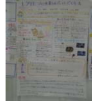
生徒が作成したポスター