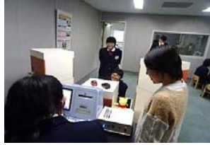
聴力検査を体験させていただいた生徒