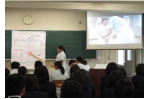
実演を交えた発表

11月30日(水)に、1年生が9月の介護実習で学んだことを施設ごとにポスターにまとめ、施設ごとに学びの深かったテーマにそって発表しました。発表内容は、「様々な利用者の方とのコミュニケーションのとり方」などです。ポスターにはイラストをうまく取り入れ、実演を行うなど工夫を凝らした発表でした。後ろの人にも見えやすいようにスクリーンで映していたので、見ている2・3年生にも分かりやすかったです。生徒たちが作成したポスターは、事務室前に掲示してあります。是非ご覧ください。