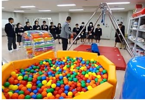
作業療法学のレクリエーション実習室の見学の様子

11月28日(月)に、総合福祉類型の2年生13名が、広島国際大学へ行きました。今回は、黒瀬キャンパスの総合リハビリテーション学部の理学療法学・作業療法学・言語聴覚療法学・義肢装具学の施設見学を行いました。リハビリの専門職の仕事内容や、医療・福祉の連携について学びました。