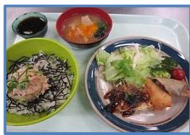
寮生ある日の夕食メニュー