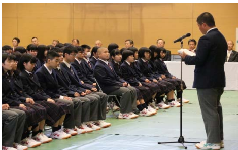
生徒会長歓迎の言葉